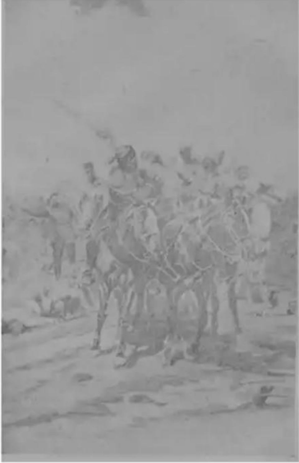
القومندان لای و قد أصیب بجرح ممیت فی امریکہ کابوری